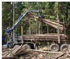
Манипуляторы для леса и лома