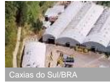
Caxias do Sul/BRA