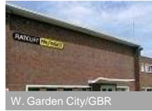
W. Garden City/GBR